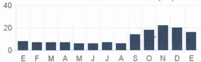
Consumo de los últimos 13 meses (M3)