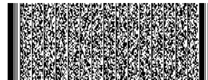
Timbre Electrónico SII

El acuse de recibo que se declara en este acto, de acuerdo a lo dispuesto en la letra b) del Art. 4º, y la letra c) del Art. 5º de la Ley 19.983, acredita que la entrega de mercaderías o servicio(s) prestado(s) ha(n) sido recibido(s).