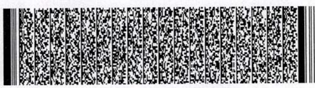
Timbre Electrónico SII