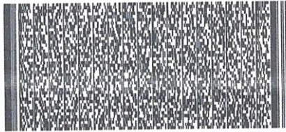
Timbre Electrónico SII

Res.99 de 2014 Verifique documento: www.sii.cl