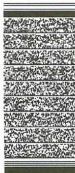
Timbre Electrónico SII Verifique su boleta en www.onepaytransbank.cl

FECHA 29/07/2022 HORA 12:17:57 TERMINAL VZT19033 FECHA CONTABLE 12:17:57 - -00 NUMERO DE TARJETA *****8033 NUM DE CUENTA C-DB Debit Mastercard A0000000041010 MONTO NETO $126.050 IVA $23.950 PROPINA $0 TOTAL $150.000 NUMERO BOLETA: 66207 NUMERO DE OPERACION: 016362 CODIGO DE AUTORIZACION: 180775 MONEDA: PESO